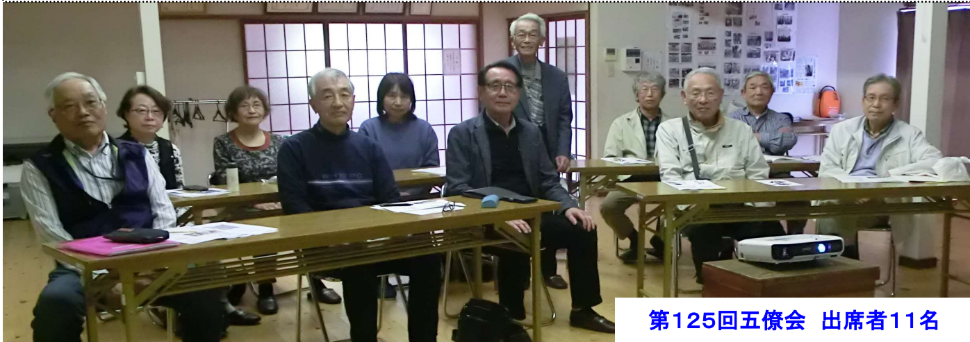
第125回五僚会 出席者11名

【本日の目次】 1. 独立運動 2. 九州独立の歴史(①奴国、邪馬台国 ②筑紫君磐井 ③懐良親王 ④黒田官兵衛 ⑤西郷隆盛) 3. 道州制