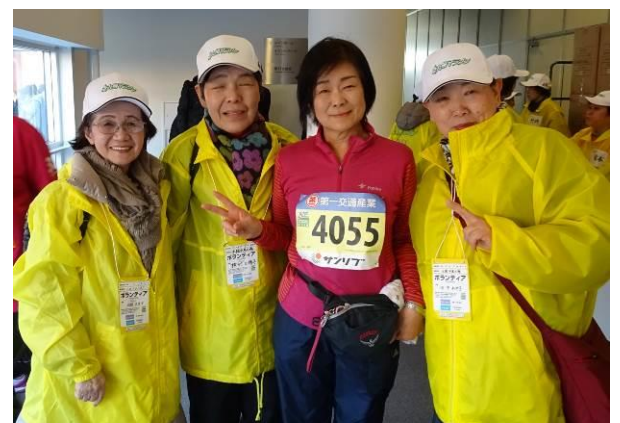
↑この方 ファンラン完走後にボランティアに参加しました