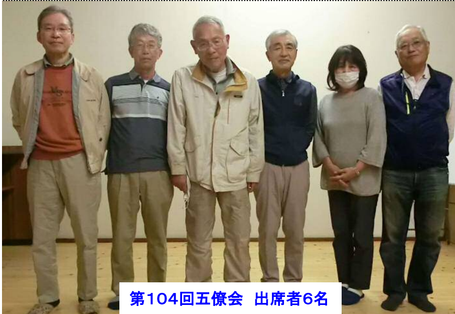
第104回五僚会 出席者6名