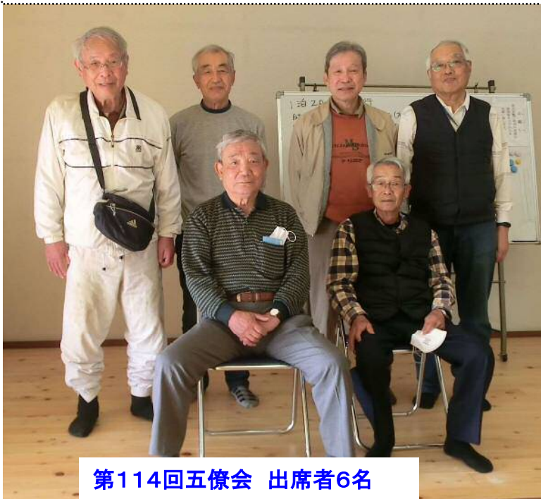
第114回五僚会 出席者6名